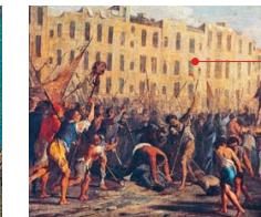
Bloedige toestanden in Napels

De scriptie heeft als onderwerp de achtergrond van de revolutie, of volksofstand, in Napels in 1647. In de geschiedschrijving komt deze gebeurtenis naar voren als enerzijds een spontane volksofstand, anderzijds als een politiek geïnspireerde revolutie. De auteur stelt dat deze verschillende beelden mogelijk worden veroorzaakt door de – subjectieve – bronnen die de betreffende historici hebben gebruikt.