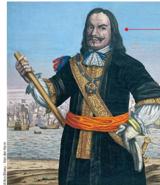
Michiel de Ruyter: volksheld

Didi van Trijp maakt deze alternatieve vorm van wetenschappelijke kennis overdragen inzichtelijk door de beschrijving van het concept van de hemelse sferen in het aristotelisch-ptolemeïsch stelsel in de geschriften van diverse redijkers. Hieruit blijkt duidelijk dat de schrijvers dit concept begrepen en het wilden overbrengen aan hun lezers, in sommige gevallen in verband met morele lessen.